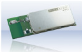
WT11 Class 1

100m Reichweite Eingebaute Antenne od. Anschluss für ext. Ant.