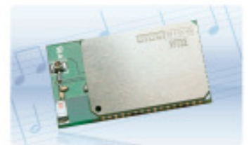
WT32 Audio Class 2

Stereo oder Mono Audio Eingebaute Antenne oder Anschluss für ext. Ant.