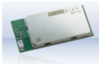
WT12 Class 2

100m Reichweite Eingebaute Antenne Ohne iWRAP